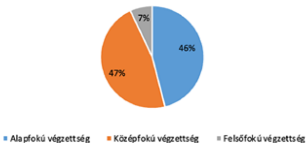
A Szentlőrinci járás népességének legmagasabb befejezett iskolai végzettsége

A helyi tudástőke és kompetencia feltérképezése érdekében vegyük szemügyre a Szentlőrinci járás képzettségi mutatóit. A Központi Statisztikai Hivatal 2011-es adatai szerint a járás népességének alig több mint a fele rendelkezik általános iskolai végzettségnél magasabb képe- sítéssel. A szakmát szerzett, de középfokú érettségi nélküli oklevéllel rendelkező lakosok száma minimális eltéréssel megegyezik az érettségi bizonyítvánnyal rendelkezők számarányával. Az egyetemet vagy főiskolát végzett, felsőfokú végzettséggel rendelkező lakosok aránya viszont elenyésző a járás össznépességéhez képest.