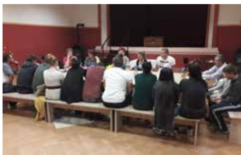
Egyeztetés Sumonyban a Hátrányos helyzetű szervezeteket támogató workshopon

még szükségesnek a tevékenységeik fejlesztését, milyen beavatkozási pontokra lenne szükség. A résztvevők úgy látták, hogy a településen és a térségben élő hátrányos helyzetű lakosság viszonylag széleskörű segítségnyújtást kap (pl. beiskolázás támogatás, ifjúságvédelmi feladatok, érdekképviselés, közösségek megerősítése, felzárkóztatás, foglalkozási helyzet javítása, élelmiszeradományok gyűjtése és osztása stb.). Komoly terhet ró viszont e feladat a segítő munkatársakra, akiknek a szakmai és mentális támogatására mindeztidáig kevés figyelmet fordítottak. Azonban ezek nélkül a hátrányos helyzetűeket támogató munka nem biztosítható hosszú távon és magas színvonalon. Vagyis a jobb minőségű munkavégzés érdekében szükség lenne arra, hogy segítsék a szervezetek a munkatársaikat az említett kérdésekben. De ezen felül megegyeztek abban is, hogy az elvégzett feladatokat megpróbálják a szervezetek összehangolni, a hasonló feladatokat kooperatívan elvégezni. Mindez ugyanis jelentősen növelheti az elvégzett szociális és felzárkóztató tevékenység hatékonyságát. Ráadásul a kettős feladatelvégzés megszűnése segíthet a feladatok racionalizálásában, és így összességében (humán és anyagi) erőforrások szabadulhatnak fel, amelyek további feladatok elvégzésére lehetnek fordíthatók.