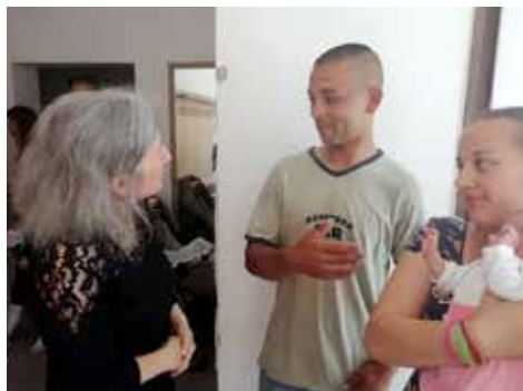
Előadás és tanácsadás szülőknek Királyegyházán