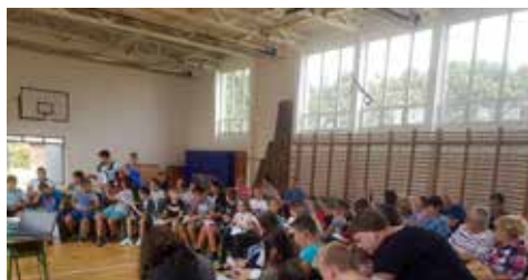
Előadás Bicsérden az Ifjúsági információs nap keretében

A pályaválasztás előtt álló fiatalok számára történő információnyújtás jegyében 2019. szeptember 6-án ifjúsági információs napot szerveztünk Bicsérd községében. A program célcsoportját a 7. és 8. osztályos tanulók, valamint szüleik alkották. Az esemény egyfajta hiánypótló jel-