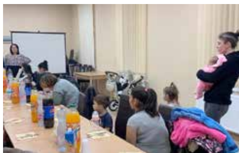
Résztevők a szabadszentkirályi Nő a gyermekem – Segítség c. programon

Végül az előadásokat követően lehetőség nyílt személyes tanácsadásra is. Ez azért volt fontos, mert itt tudtak igazán megnyílni saját problémáikkal a szülők, és így kaphattak személyre szabott megoldási javaslatokat is.